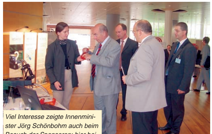
Viel Interesse zeigte Innenminister Jörg Schönbohm auch beim Besuch der Sponsoren; hier bei der Firma Jobin Yvon, die sich auf forensische Systeme spezialisiert hat.

Zur Beschlussfassung lagen zahlreiche Anträge vor. Viele dieser Anträge spiegeln die