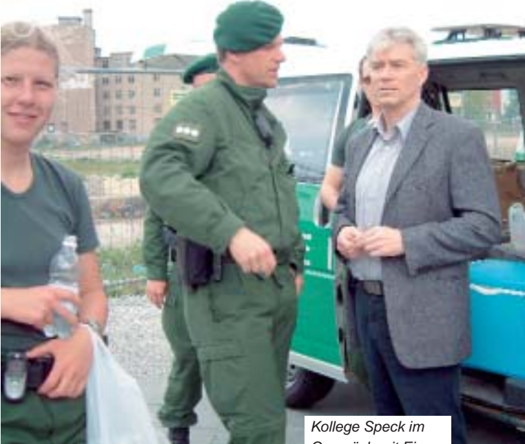
Kollege Speck im Gespräch mit Einsatzkräften.

stattet mit Erfrischungen, Snacks und Infomaterial, versorgten die „Mannschaften“ der DPoIG-Busse die eingesetzten Kolleginnen und Kollegen und standen mit Rat und Tat bereit.