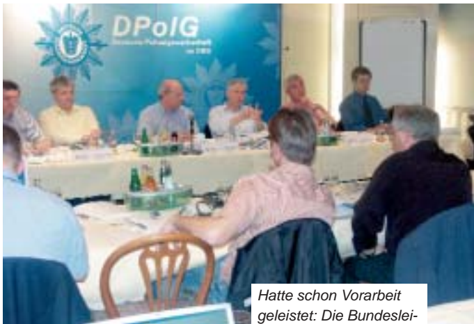
Hatte schon Vorarbeit geleistet: Die Bundesleitung der DPoIG.