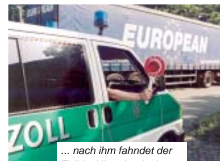
... nach ihm fahndet der Zoll im Hinterland mit mobilen Kontrollgruppen.

te grenzüberschreitende Zusammenarbeit von Polizei und Justiz könne die grenzüberschreitende Kriminalität aber besser bekämpft werden.