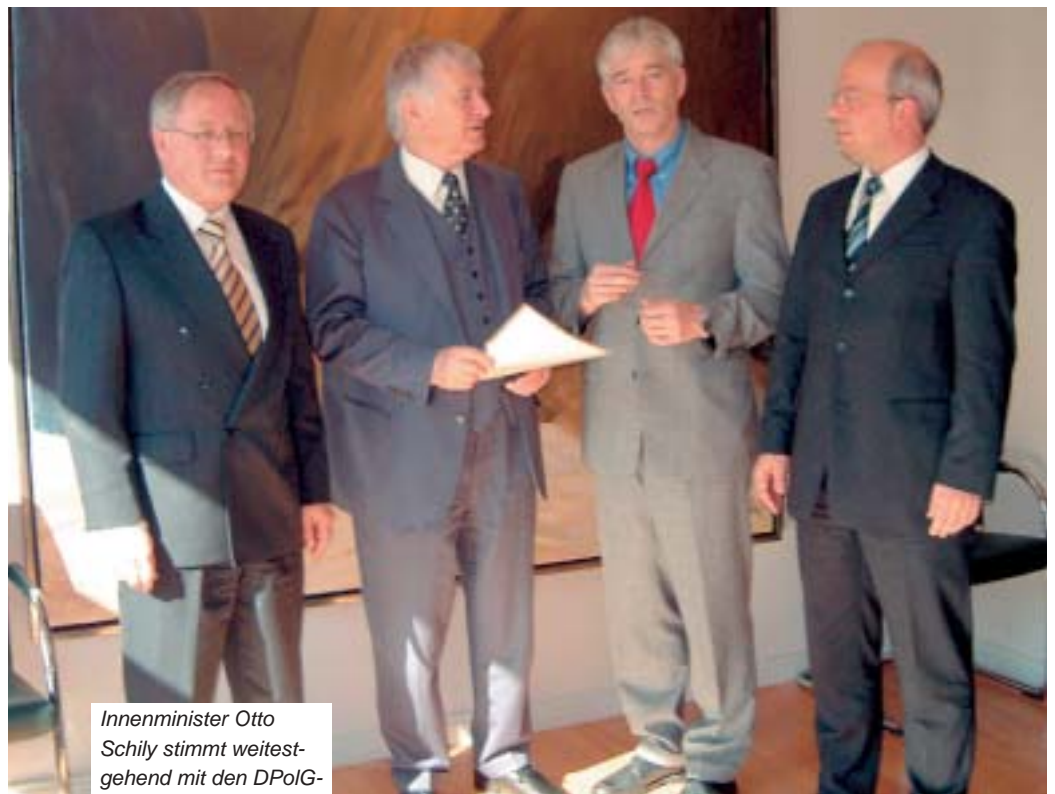
Innenminister Otto Schily stimmt weitestgehend mit den DPoIG-Positionen überein.

Dieses Tun, so stimmten DPoIG und Schily auch beim nächsten Gesprächsthema überein, darf