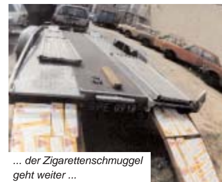
... der Zigaretten- und Schmuggel geht weiter ...