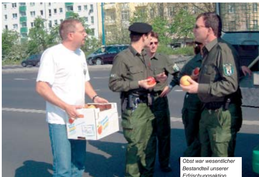
Obst war wesentlicher Bestandteil unserer Erfrischungsaktion.

Um die Einsatzkräfte zu unterstützen, schickte die DPolG wieder ihr bewährtes 1.-Mai-Betreuungsteam los. Ausge-